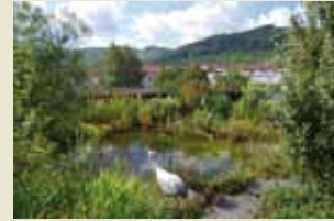
...traumhaft schöne Dachgärten