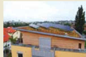
...technisch anspruchsvolle Gründach-Objekte