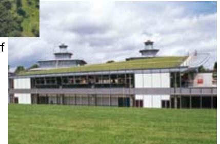
Universität Cambridge, England