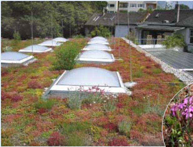
Schule am Fürstenwall