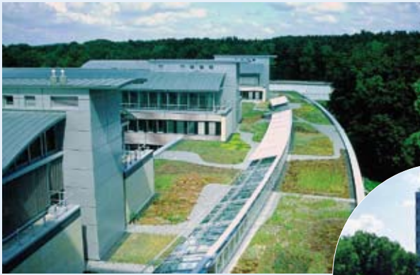
InvestitionsBank des Landes Brandenburg