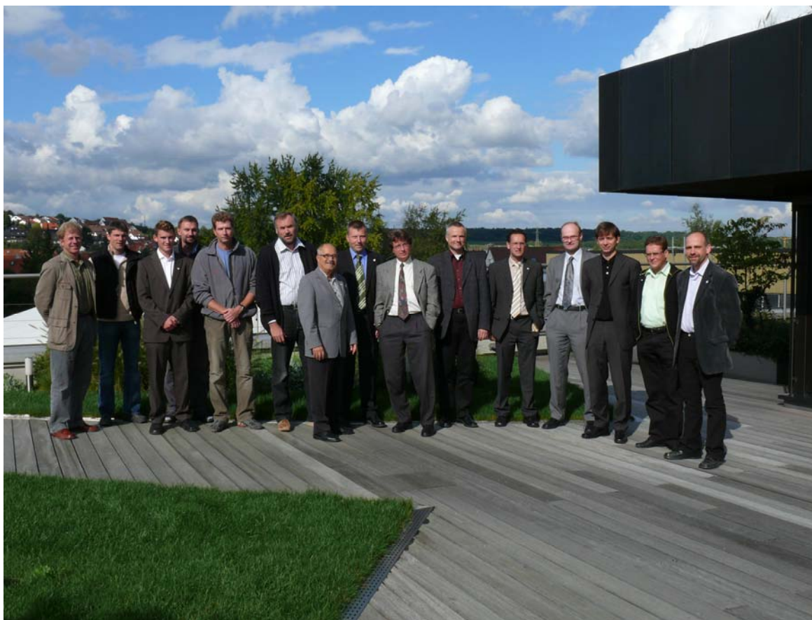
Abb. 1: Die Arbeitsgruppe „Sicherer Gewerkeübergang“